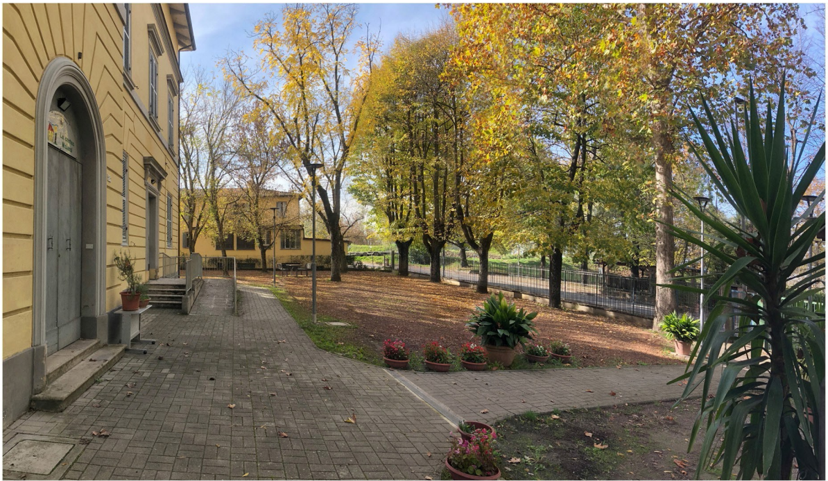
Immagine 1: stato di fatto