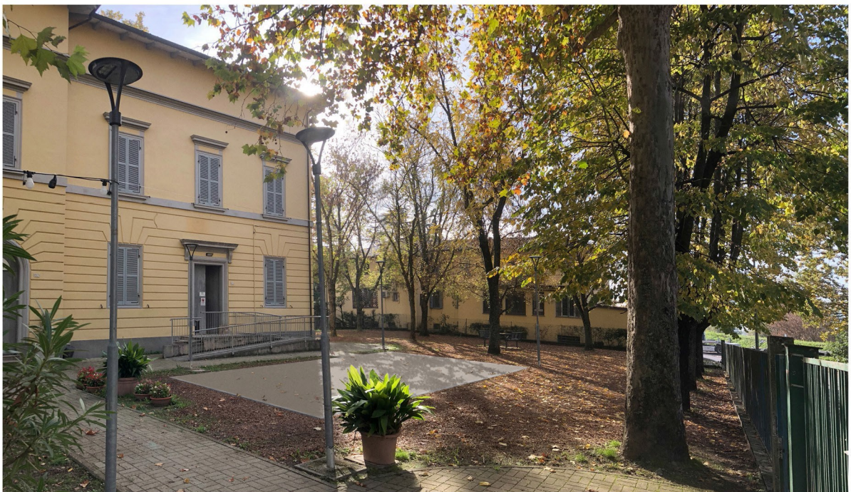
Immagine 2: soluzione di progetto