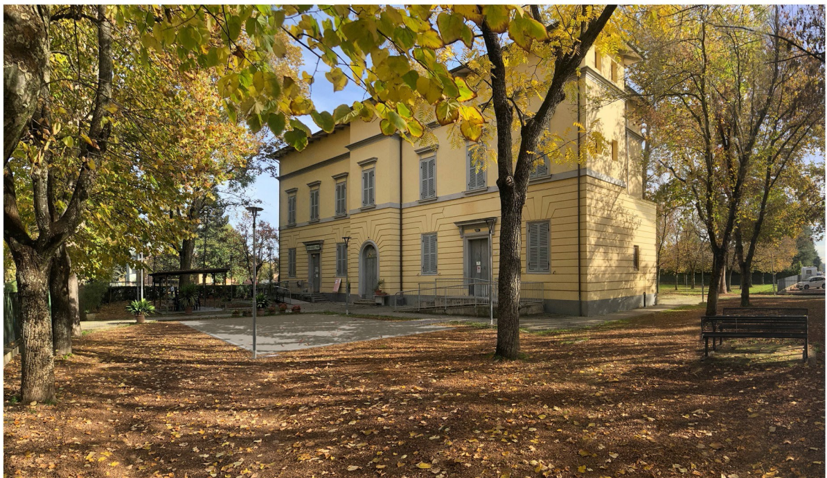
Immagine 3: soluzione di progetto