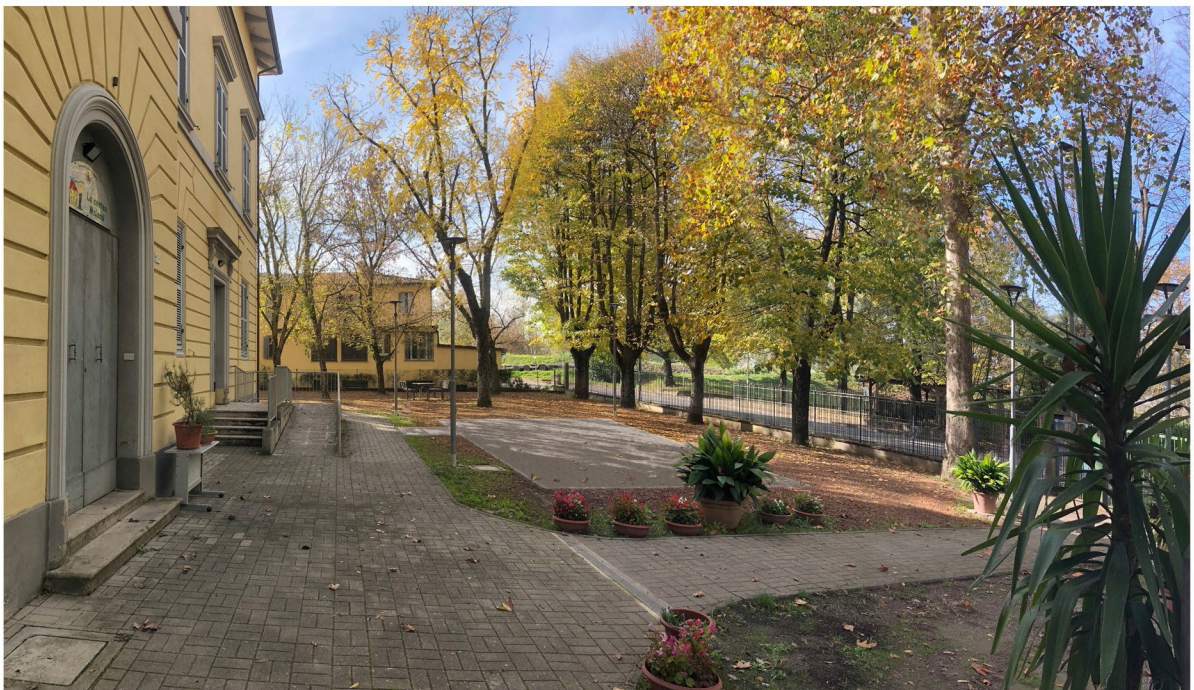
Immagine 1: soluzione di progetto